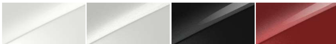
Casa White (WD)