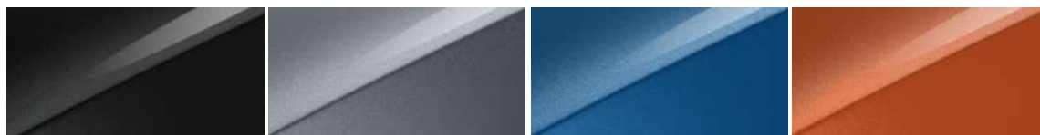
Penta Metal (H8G)