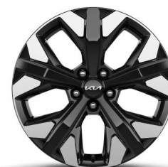
Jante aliaj de 19" Tip B