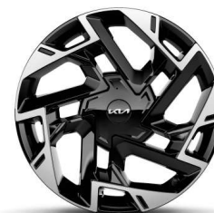
Jante aliaj de 19"