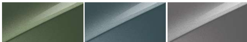
Experience Green (EXG)