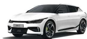
Snow White Pearl (SWP)