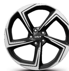
Jante aliaj 21"