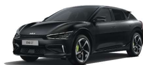
Aurora Black Pearl (ABP)