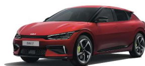
Runway Red (CR5)