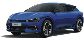
Yacht Blue (DU3)