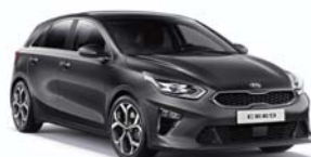
Dark Penta Metal