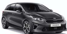
Dark Penta Metal